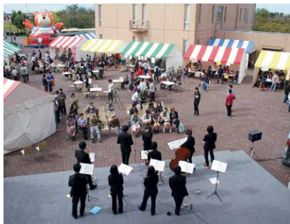
屋台と学生ステージなど、皆さまに楽しんでもらいました