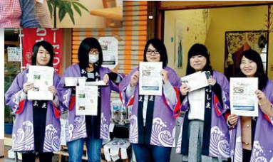
粟島プロジェクト