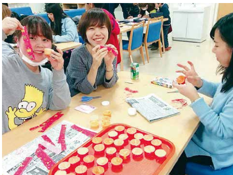
学生寮にてサンタ・プロジェクトのキャンドルづくり

チャペルに引き続いてもたれるアッセンブリ・アワーは、主に、社会や世界で活躍されている方々のお話をうかがう時間です。お招きする方々の多くは、国内外にあって助けを必要とする人々に寄り添い支える尊い働きをされている方々で