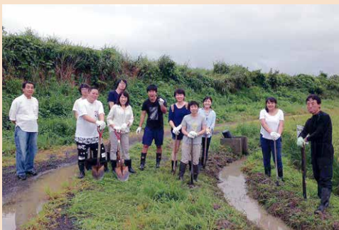
ピオトープ作りに挑戦（左から4人目が房先生）