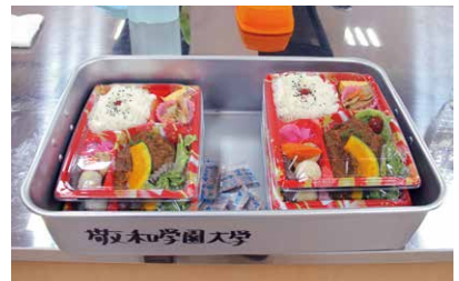
希望者には栄養バランスを整えた夕食（500円）を提供