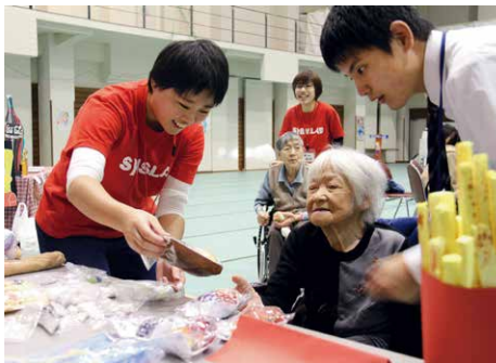
利用者の皆さまと一体になって楽しみました