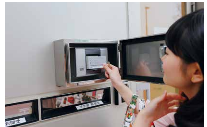
入口はカードキーでセキュリティ面も安心