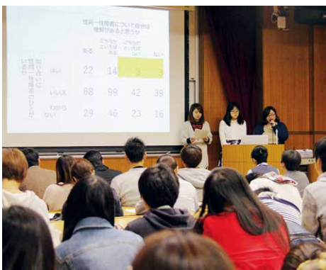
チャペル・アッセンブリ・アワーで発表する学生たち

「生きる力を養う」ということが教育界において取り沙汰されるようになって久しいですが、その言葉は、競争社会において勝ち残る力をつけさせるという意味合いで使われているような気がしてなりません。しかしながら、本学が若者たちの中に培おうとする力は、そのような生き残りの力ではなく、人と人が生かし合い、支え合うことによって深く結ばれていくような(その際、弱い立場の人々が排除されることなく、むしろ中心に置き直されていくような)共に生きる社会を創造していく力であるといつてよいで