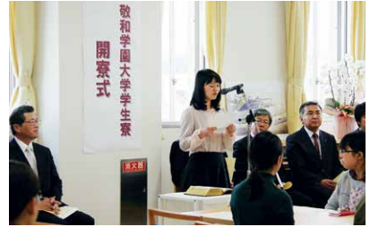
学生寮開寮式（2016年4月16日）