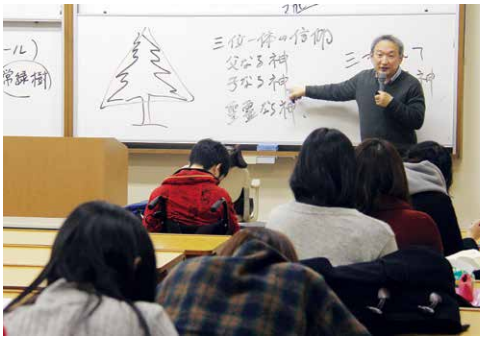
12月は、クリスマスツリーの起源を紹介