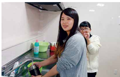
コミュニティルームにある広いキッチン