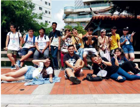
同世代の若者たちと交流を深めました