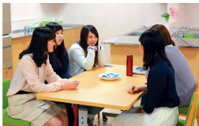
楽しいことも困ったことも寮生同士で共有