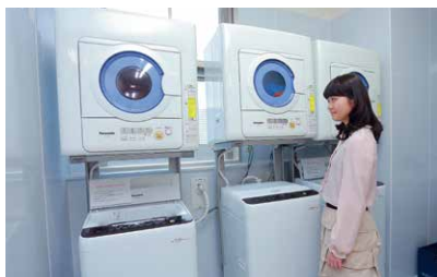
乾燥機つきのランドリーはいつでも使えます