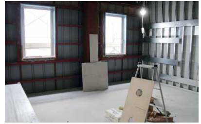
建設中の学生寮（居室）

敬和学園大学は、今年四月、創立二五周年記念事業の一環として、産官学の連携の下で学生寮を開設しました。リベラルアーツの学びを深めるため、大学と新発田市が連携し、次の三点に重点をおいた寮運営をすすめています。