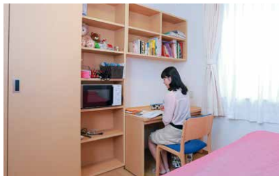
個室には家具類が備え付けられています

学生寮は、大学からだけでなく、地域社会の方々との関わりから学び、地域社会に貢献できる人材を育成する場となることを目指しています。