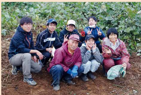
住民の方と一緒にアマドコ口の根茎を採取しました

「栗島フェア」では、学生たちが栗島伝統料理を現地の地域住民から伝授してもらい提供する「栗島ランチ」を二回実施しました。また、「アマドコ口茶の開発」では、栗島に広く分布する山菜の一種であるアマドコ口の根茎に注目し、商品化を目指して、試飲会などを開いています。これらの活動については、来年二月に栗島浦村での報告会開催を予定しています。(共生社会学科 趙)