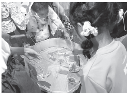
釣りゲームの様子。海洋ゴミを釣り上げる